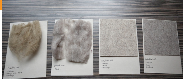
Proefstalen van wol van Gescheperde kuddes, onderdeel van het AmbachtenLab.

In 2020 heeft het Kenniscentrum voor dit project een incidentele subsidie aangevraagd bij het Fonds voor Cultuurparticipatie, die vervolgens is toegekend. Nadat duidelijk werd dat door de coronacrisis de doorlooptijd van het project mogelijk niet gehaald zou worden, heeft het Kenniscentrum bij het Fonds voor Cultuurparticipatie één jaar uitstel aangevraagd. Dit uitstel is toegekend. Op 31 december 2022 is het project afgerond. Het is echter helaas niet gelukt om alle nog openstaande AmbachtenLabs te realiseren. Uiteindelijk zijn slechts twee van de vier geplande AmbachtenLabs die door het Fonds voor Cultuurparticipatie zouden worden gefinancierd uitgevoerd. In 2021 was dat het AmbachtenLab 'Borduren' in het Fries Museum en in 2022 het AmbachtenLab 'Klompen Maken' (stap 2) in het Nederlands Openluchtmuseum. Dit KlompenLab kon met medewerking van vier studenten van ROC Rijn IJssel in het eerste kwartaal van 2022 in het Nederlands Openluchtmuseum worden uitgevoerd. De resultaten van dit