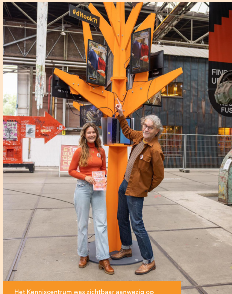
Het Kenniscentrum was zichtbaar aanwezig op het Ambacht in Beeld Festival in Amsterdam.

Het Kenniscentrum was zichtbaar aanwezig tijdens het Ambacht in Beeld Festival op zaterdag 24 en zondag 25 september in de NDSM Loods in Amsterdam-Noord. Het Ambacht in Beeld Festival legde de nadruk op traditioneel ambachtelijk vakmanschap. Tijdens dit tweedaagse festival, dat bol stond van internationale masterclasses,