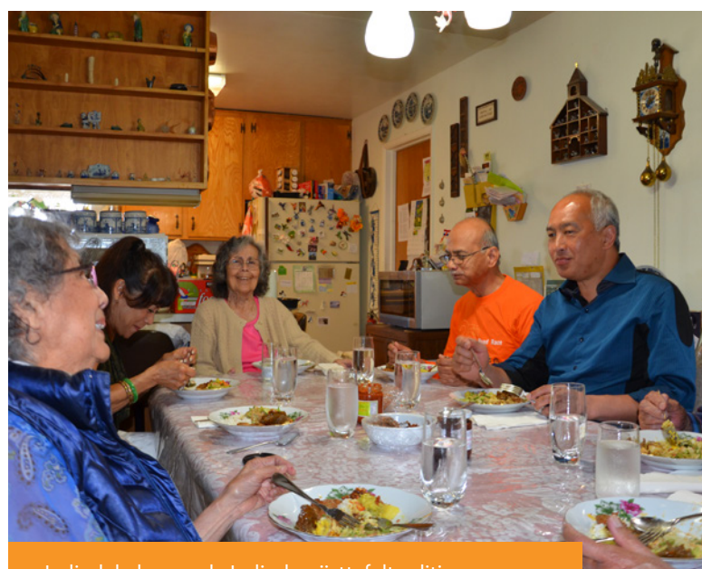
Indisch koken en de Indische rijsttafeltraditie; dit immaterieel erfgoed werd in 2022 bijgeschreven in de Inventaris.

De nieuwsbrief werd in 2022 goed gelezen: gemiddeld is deze door 55-60% van de ontvangers geopend.