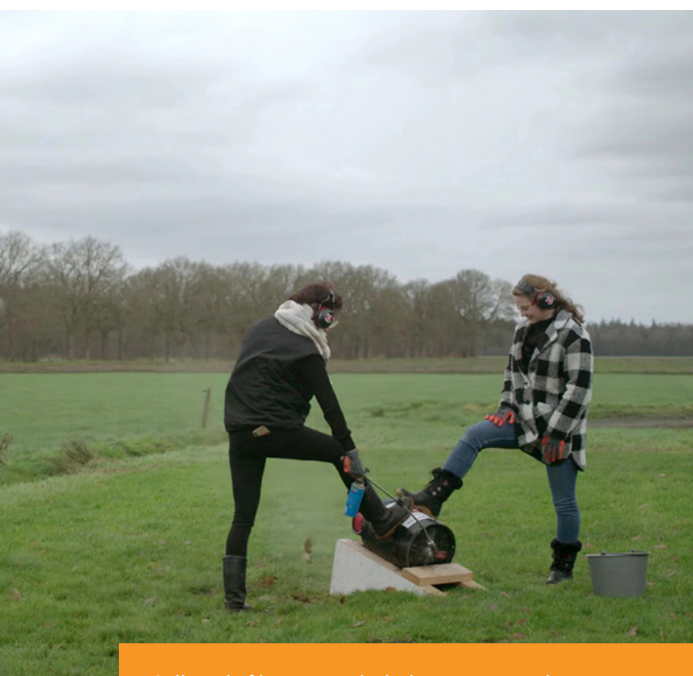
Still uit de film over carbidschieten in Drenthe.