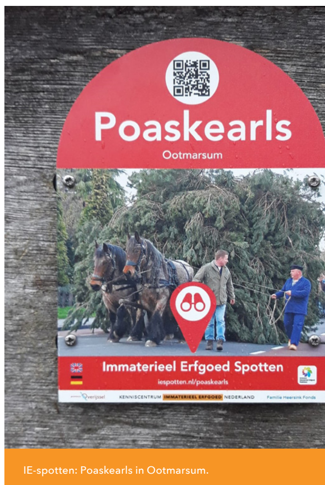
IE-spotten: Poaskearls in Ootmarsum.

"IE-Spotten is een landelijk project, maar het beoogt immaterieel erfgoed lokaal op de kaart te zetten."