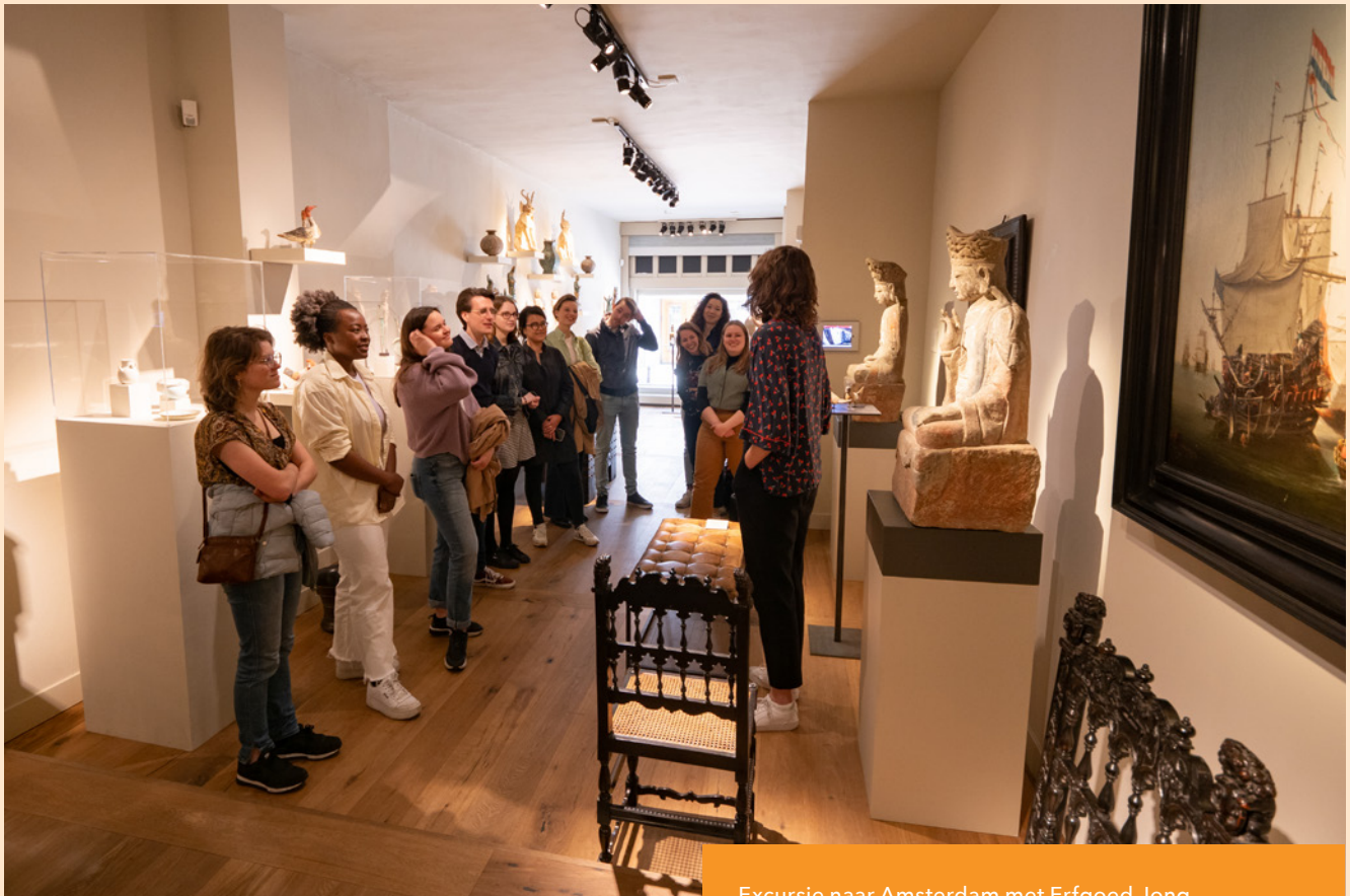
Excursie naar Amsterdam met Erfgoed Jong.