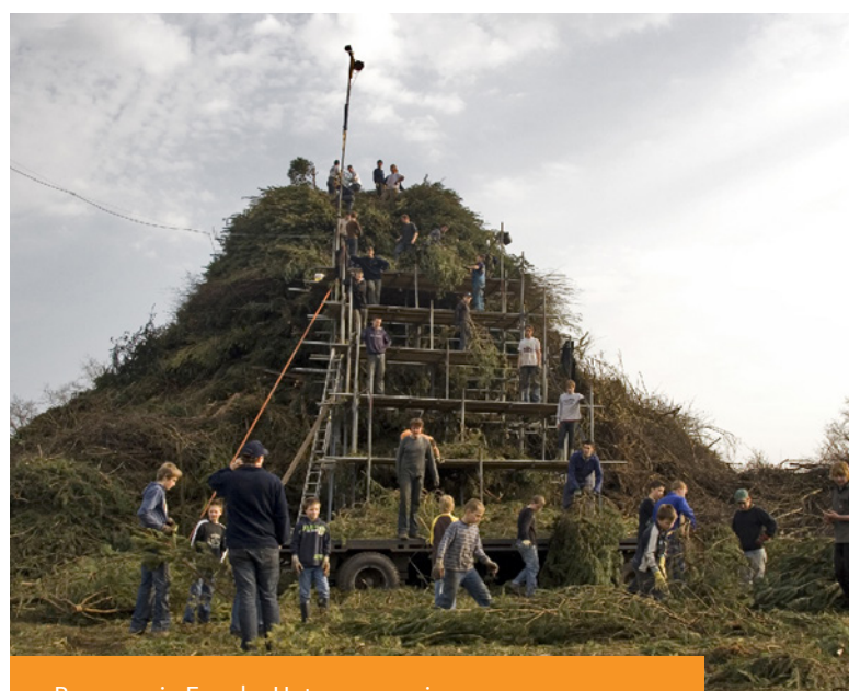
Paasvuur in Espelo. Het paasvuur is een vorm van immaterieel erfgoed dat in 2022 in het nieuws is geweest.

“Er is onder journalisten meer kennis rondom het begrip immaterieel erfgoed.”