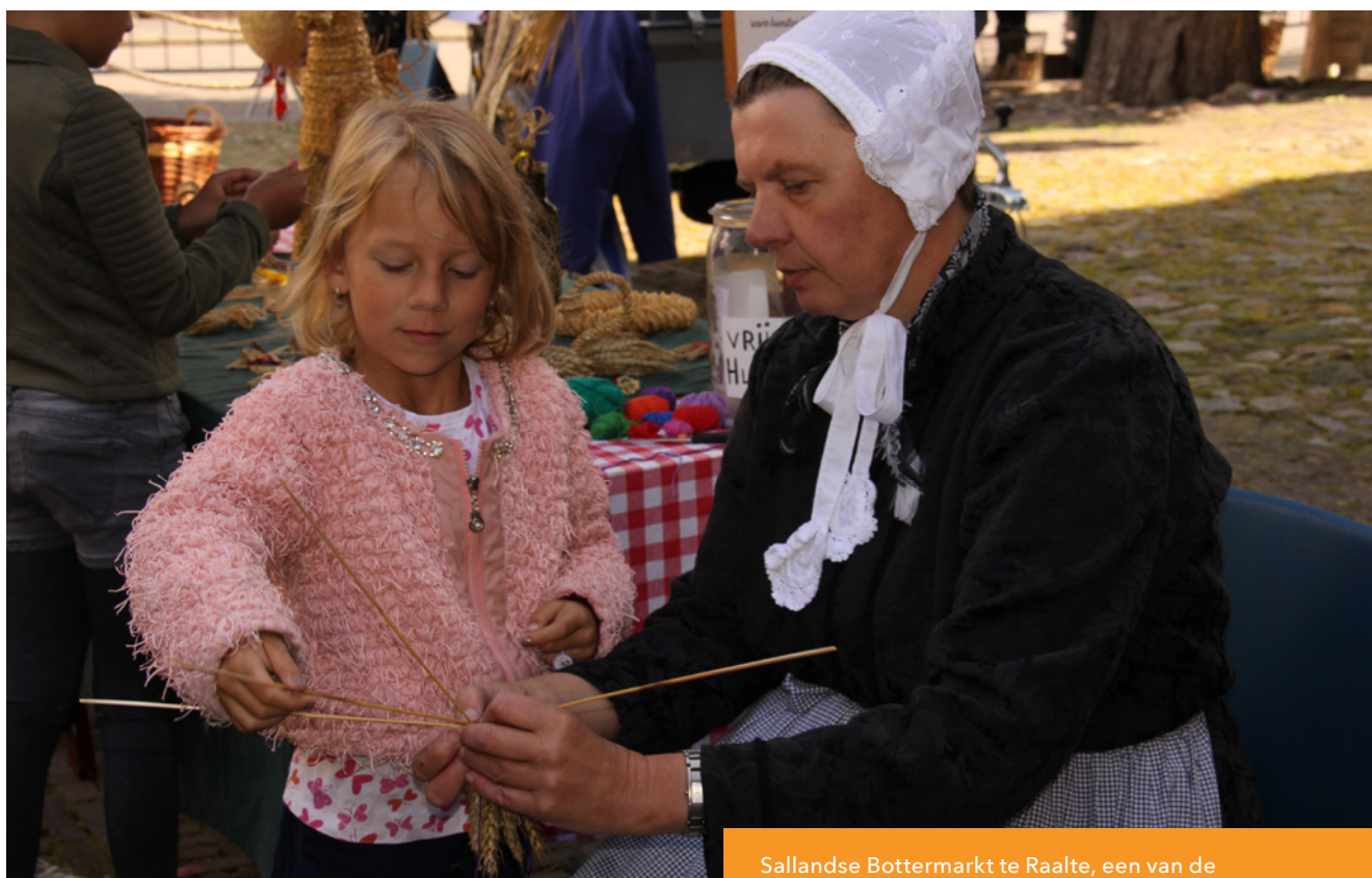
Sallandse Bottermarkt te Raalte, een van de voorbeelden van immaterieel erfgoed in Overijssel.

Als gevolg van de coronabeperkingen die tot het eerste kwartaal 2022 van kracht waren zijn het overgrote deel van de activiteiten in de tweede helft van 2022 uitgevoerd.